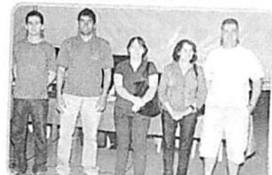
Componentes do Lar Verde Lar eleitos na 59ª AGE